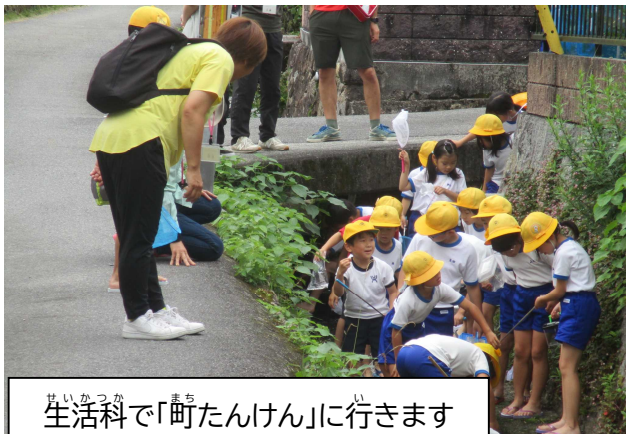
生活科で「町たんけん」に行きます