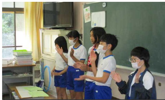
運動会応援練習 では、 リーダー としてみんなを 引っ張り ます