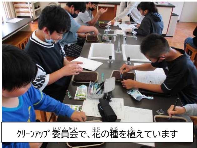
クリーンアップ委員会、花の種を植えています

★いろいろな 行事 において、自分たちで 計画 や 準備 をします。 計画する力 が必要です。