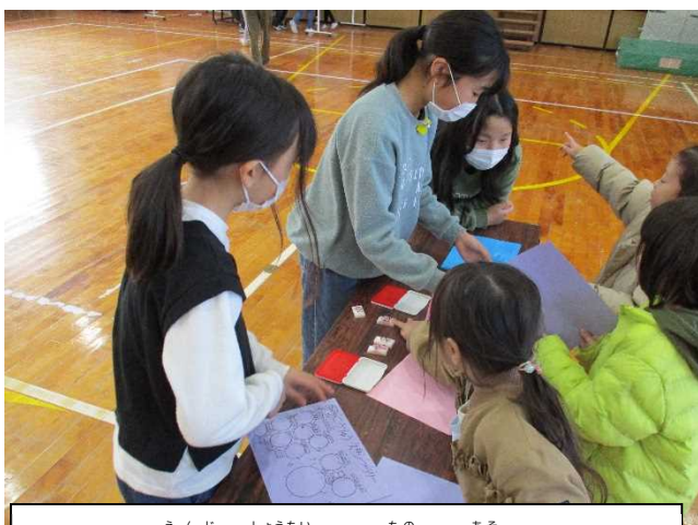
5さいの園児を招待して、楽しく遊べるような活動を 計画 して、活動します。(5・5交流会)