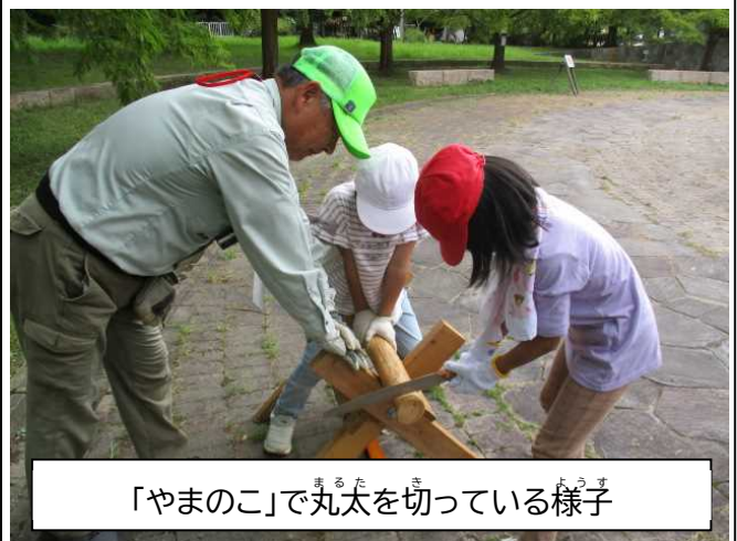
「やまのこ」で丸太を切っている様子