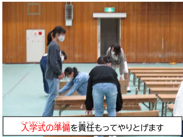
入学式 の 準備 を 責任 もってやりとげます

★「 修学旅行 」に行って、 平和学習 、 集団行動 について学びます。自分たちで 考え て 行動 します。