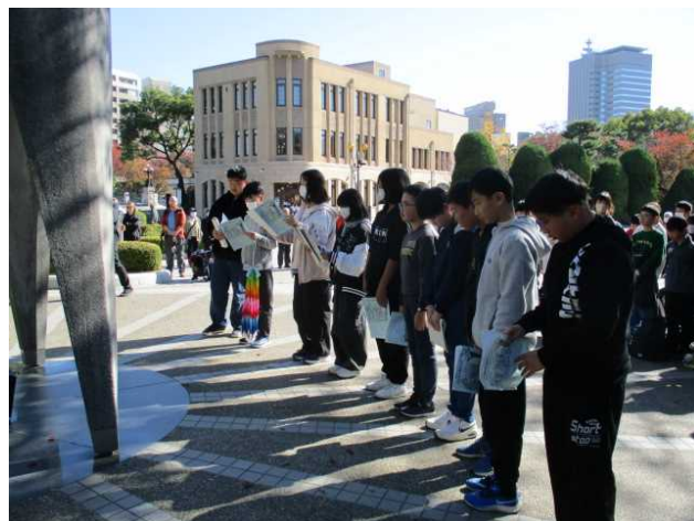
「いのちかがやく 策小 」 最高学年 として、「 修学旅行 」に行って、 平和 について学びます